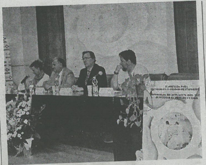
Las jornadas se desarrollaron en el Comarcal