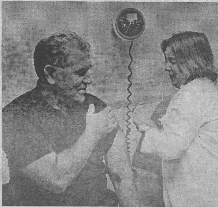
El director territorial de Ingesa se vacunó

años, unos 6.700 melillenses, se vacunen, y que también lo hagan los enfermos crónicos, el personal sanitario, los Cuerpos y Fuerzas de Seguridad del Estado y también el colectivo de mujeres embarazadas. Pidió Robles al personal sanitario su máxima colaboración y que se vacunen, apelando para ello, al papel "ejemplarizante" que esto supondría para el resto de compañeros y la población en gene-