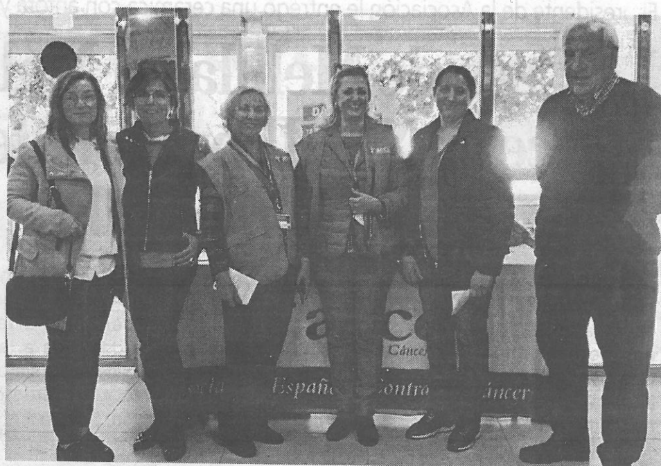
Mesa en el centro de salud de Polavieja

La Dirección Territorial del Ingesa y la Consejería de Presidencia y Salud Pública arroparon la jornada