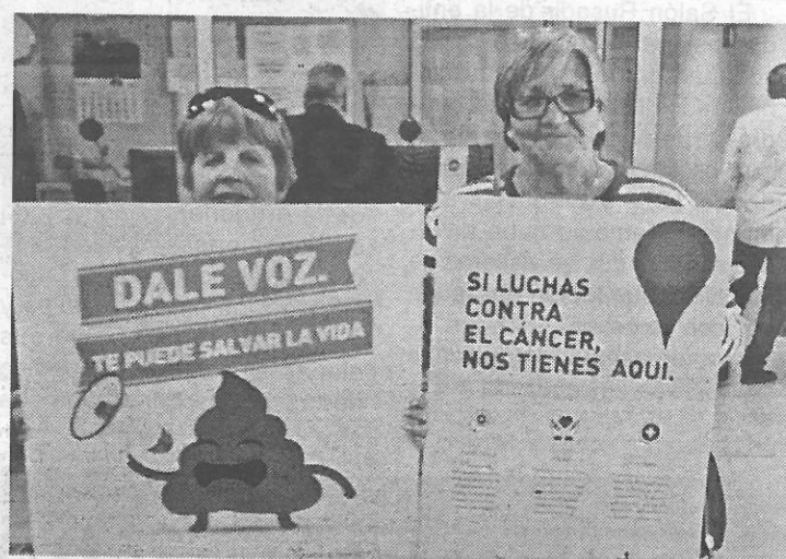
Dos voluntarias con la mascota de la campaña

Con motivo del "Día Mundial Contra el Cáncer de Colon" que se celebra el 31 de marzo, la AECC de Melilla viene desarrollando distintas actividades para concienciar y sensibilizar a la población. En concreto, los voluntarios han repartido dípticos informativos de prevención en distintas empresas de alimentación de la ciudad y ayer se instalaron distintas mesas informativas, como la del Hospital Comarcal, que contó con el apoyo del director territorial del Ingesa y la consejera de Presidencia.