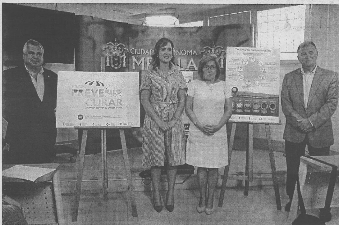
Ingesa, Colegio de Farmacéuticos, la AECC y la Consejería de Presidencia arropan la campaña