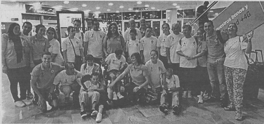
El grupo de excursionistas antes de iniciar el viaje